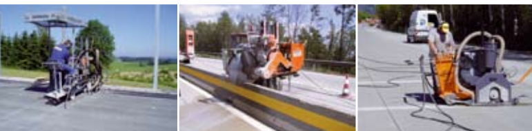
«POSSEHL» Техника для нарезки и герметизации швов, для ремонта трещин

« POSSEHL THERMOFLEX » для разграничения при помощи цвета границ бетонных и асфальтных поверхностей, напр. для перекрестков, велосипедных дорожек и т.п.