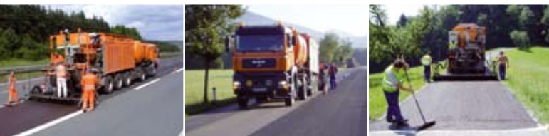
«POSSEHL DSK» - Тонкие слои асфальта в холодной укладке – для быстрого, экономичного и экологически безвредного ремонта проезжей части при холодной укладке

АВТОСТРАДЫ ФЕДЕРАЛЬНЫЕ, ОБЛАСТНЫЕ, РАЙОННЫЕ ДОРОГИ ГОРОДСКИЕ ДОРОГИ АВТОМОБИЛЬНЫЕ ДОРОГИ МЕСТНОГО НАЗНАЧЕНИЯ ХОЗЯЙСТВЕННЫЕ ПРОЕЗДЫ ВЕЛОСИПЕДНЫЕ/ ПЕШЕХОДНЫЕ ДОРОЖКИ МОСТЫ ТОННЕЛЬНЫЕ УЧАСТКИ ШКОЛЬНЫЕ ДВОРЫ ПЕШЕХОДНЫЕ ЗОНЫ