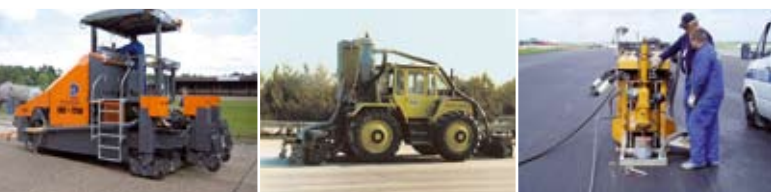
«POSSEHL» Техника для шлифовки и улучшения шероховатости покрытий, техника для нарезки канавок и для бурения кернов

« POSSEHL » Техника для шлифования и восстановления шероховатости для улучшения шероховатости покрытия на бетонных и асфальтных проезжих частях