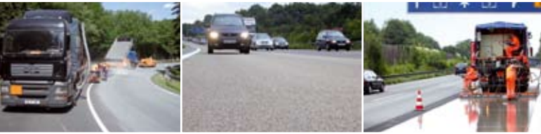
«POSSEHL EP-GRIP» для улучшения шероховатости покрытий, а также для уменьшения шума

АВТОСТРАДЫ ФЕДЕРАЛЬНЫЕ, ОБЛАСТНЫЕ, РАЙОННЫЕ ДОРОГИ ГОРОДСКИЕ ДОРОГИ АВТОМОБИЛЬНЫЕ ДОРОГИ МЕСТНОГО НАЗНАЧЕНИЯ ХОЗЯЙСТВЕННЫЕ ПРОЕЗДЫ ВЕЛОСИПЕДНЫЕ/ ПЕШЕХОДНЫЕ ДОРОЖКИ МОСТЫ ТОННЕЛЬНЫЕ УЧАСТКИ ШКОЛЬНЫЕ ДВОРЫ ПЕШЕХОДНЫЕ ЗОНЫ