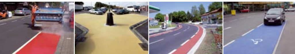
POSSEHL THERMOFLEX для повышения безопасности движения посредством цветного обозначения границ

«POSSEHL DSK» Тонкие слои асфальта в холодной укладке согласно ZTV BEA-StB 3) и TL BEA-StB 4) для экономичного и экологически безопасного сохранения субстанции дорожной поверхности, улучшения шероховатости покрытий и устранения колеи асфальтного покрытия