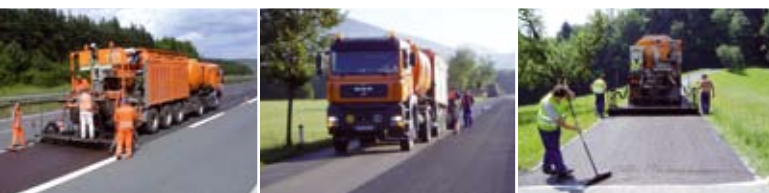
«POSSEHL DSK» - Тонкие слои асфальта в холодной укладке – для быстрого, экономичного и экологически безвредного ремонта проезжей части при холодной укладке

POSSEHL EP-GRIP согласно ZTV BEA-StB 1) и TL BEA-StB 2) для улучшения шероховатости покрытий, а также для уменьшения шума