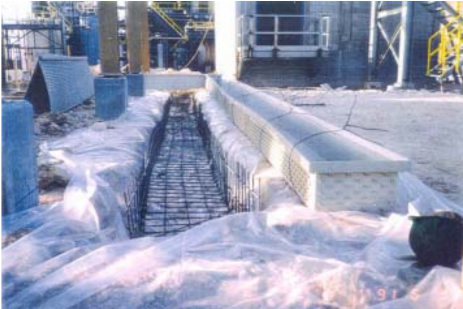
Die vorgefertigten Kanalelemente vor der Betonierung prefabricated trench segments prior to concreting

www.elitstroy.su 8 (495) 648-52-04 mail@elitstroy.su