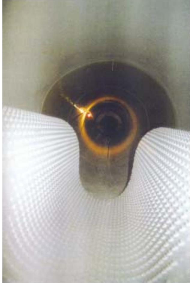
zusammengelegte AGRU Sure Grip Betonschutzplatte vor der Verlegung folded AGRU Sure Grip Concrete Protective Liner prior to installation