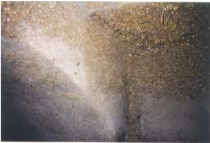
korrodierte Rohrinneoberfläche vor dem Sanieren