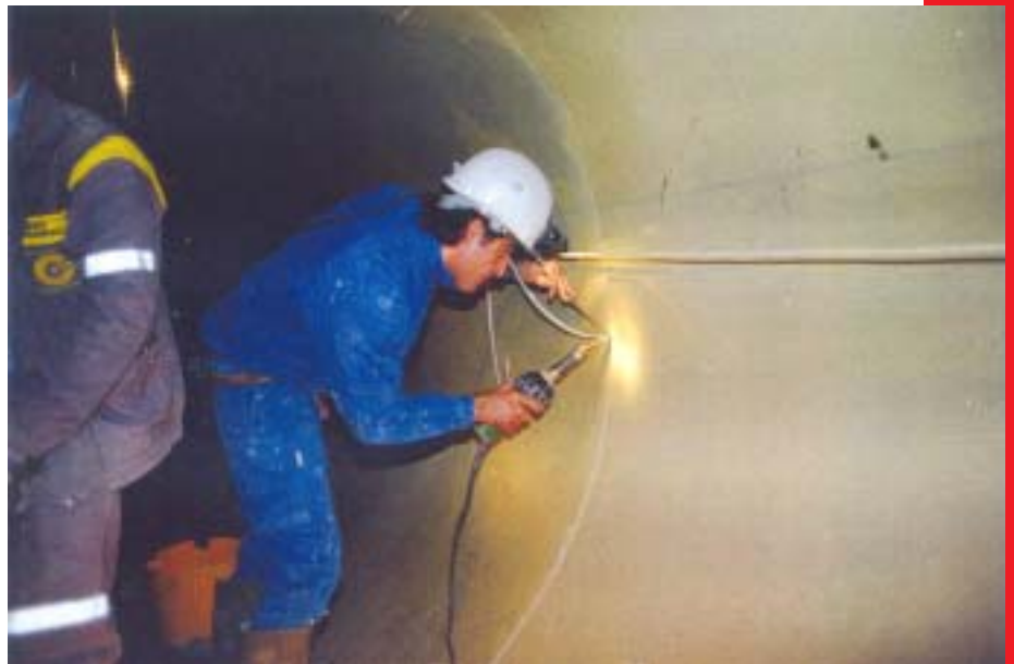
Verschweissung der AGRU Sure Grip Betonschutzplatten untereinander (Warmgasschweissen) hot air welding of Sure Grip Concrete Protective Liners among one another