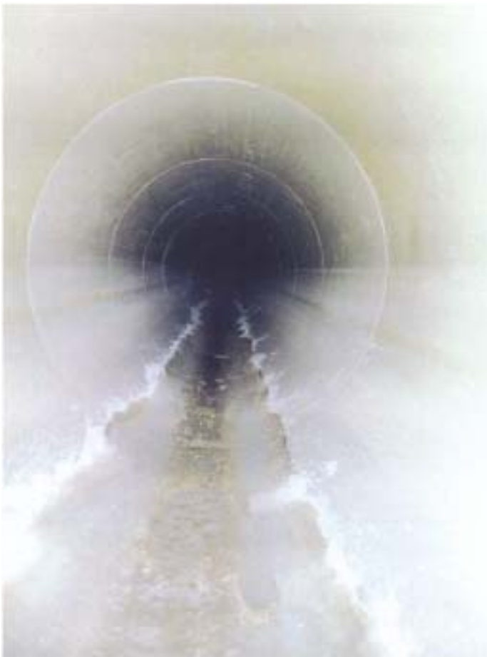
Ansicht des fertigen Rohres