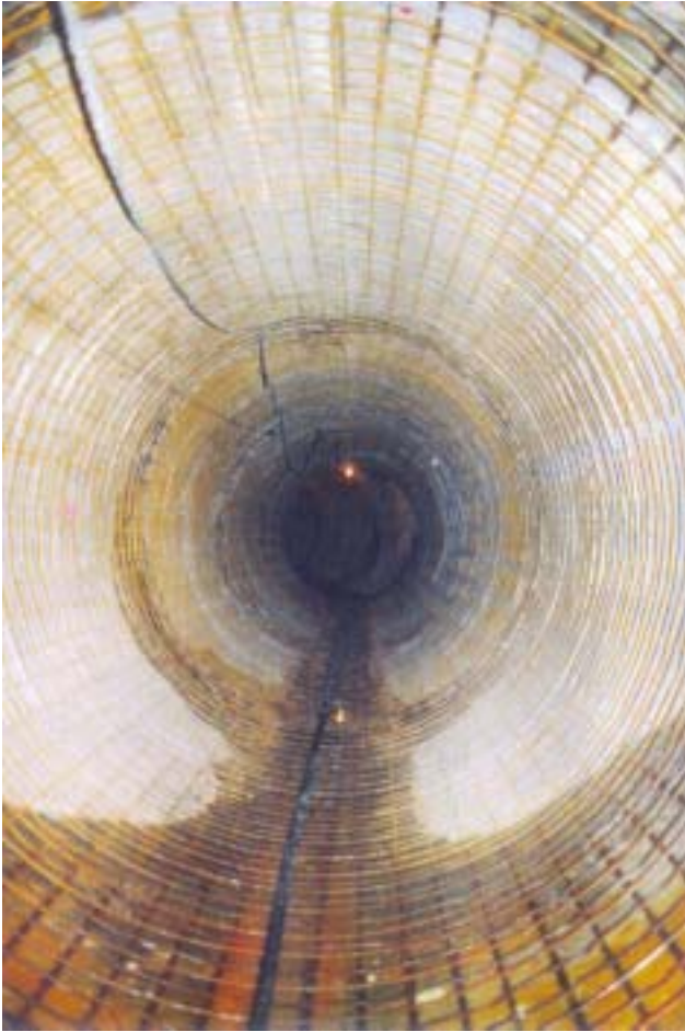
gereinigte Rohroberflaeche und montierte Bewehrung cleaned pipe surface and installed steel grid