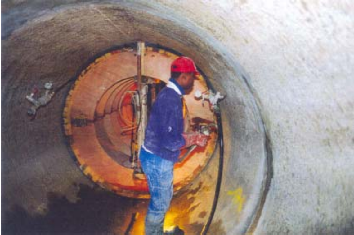
Schalungsmontage und Verfuellung des Ringspalts

assembly of the wooden form and injection of grout